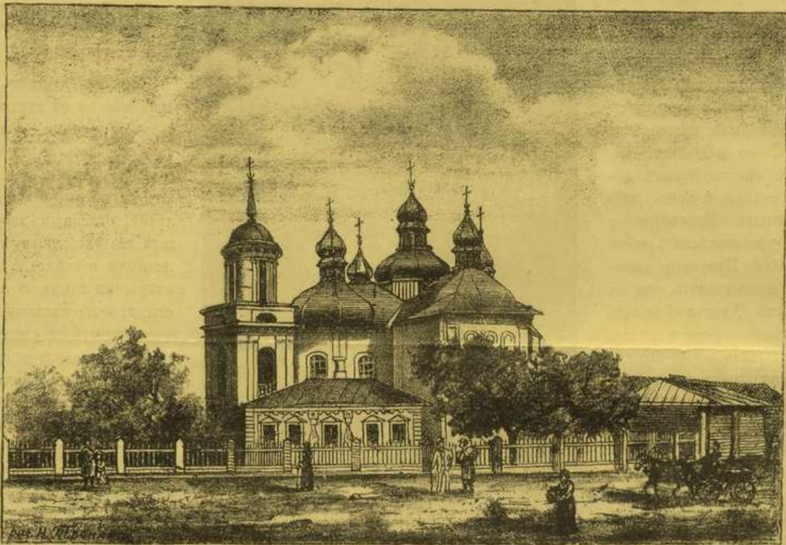
Церковь въ Берестовѣ.

истомленного сорокалѣтними странствованіями; звуки и смѣхъ его поднялись къ безмолвному лазурному небу, которое горѣло лишь съ избранными народа избраннаго; но не о небо, но и пустыня, и горы, и вода слушались мощнаго голоса вождя этого великаго, доселѣ неслыханнаго на землѣ каравана. Могучій силою, дарованною свыше, этотъ великій вождь велъ смѣло черезъ страшныя пустыни цѣлыя сорокалѣтнiя свой огромный многотысячный народъ... Именемъ Господнимъ онъ смирялъ ужасы моря и пустыни, оставивши солнце, разрушалъ скалы, разверзалъ землю и сорокалѣтнiя питалъ сотни тысячъ на пескахъ, не могущихъ нѣмъ прокричать и червяка. Исторія и мифы человѣчества не знаютъ ничего подобнаго; чудное шествіе великаго народа черезъ огромную пустыню представляетъ нѣчто непонятное, колоссальное по размѣрамъ, грандіозное по событіямъ, великое по