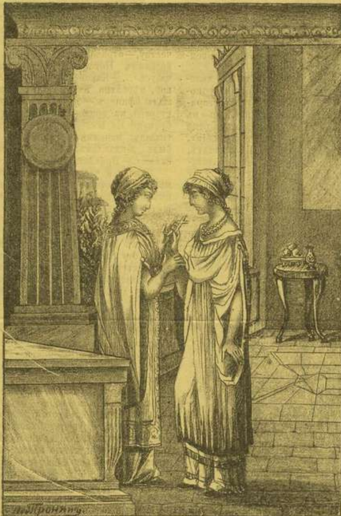
...Это былъ небольшой серебряный крестъ.