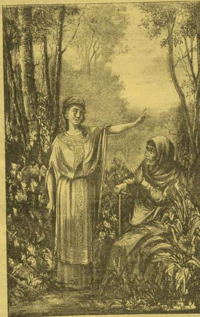
— О, какъ прекрасенъ міръ! — воскликнула молодая дѣвушка...

— Слышала, что онъ повелѣваетъ преслѣдовать тѣхъ, которые не признаютъ нашихъ боговъ, — отвѣчала Варвара. — Сказать