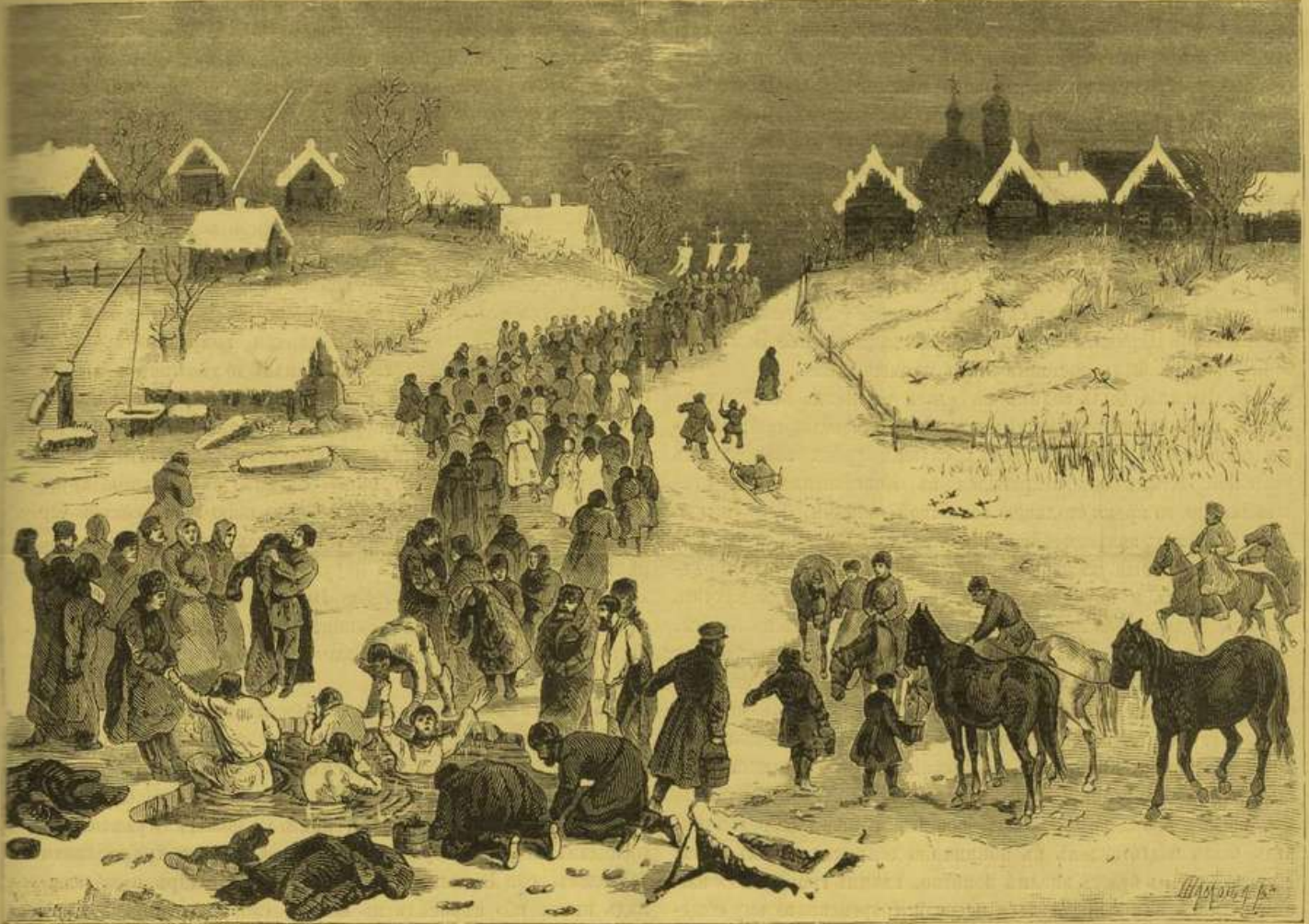
ПРАЗДНИКЪ КРЕЩЕНІЯ ВЪ ДЕРЕВНѢ.

утреннее богослуженіе, а затѣмъ и божественная литургія. Въ Успенскомъ соборѣ богослуженіе совершалъ Стефанъ, архіепископъ Рязанскій, съ многочисленнымъ духовенствомъ. Между тѣмъ находившіяся въ Москвѣ войска выступали строемъ со всѣхъ концовъ Москвы и спѣшили въ Кремль съ распушенными знаменами, съ музыкою и барабаннымъ боемъ. Самъ царь, разставивъ войска на Ивановской площади, спѣшилъ въ Успенскій соборъ для слушанія божественной литургіи, по окончаніи которой преосвященный Стефанъ произнесъ слово, въ коемъ доказывалъ, что такая перемѣна необходима. Затѣмъ, со всѣми архіереями и многочисленнымъ духовенствомъ, совер-